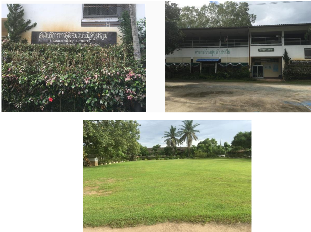
ภาพที่ 4 โครงการศูนย์พัฒนาคุณภาพชีวิตและส่งเสริมอาชีพผู้สูงอายุตำบลป่าไผ่