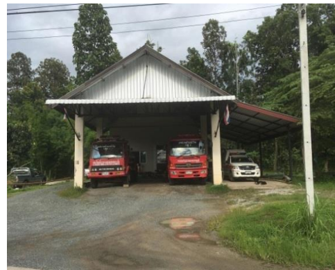
ภาพที่ 3 สำนักงานเทศบาลตำบลป่าไฟ อำเภอสันทราย จังหวัดเชียงใหม่