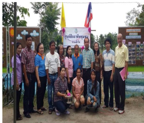
ภาพที่ 6 การดำเนินกิจกรรมโครงการสำหรับผู้สูงอายุของเทศบาลตำบลป่าไผ่ อำเภอสันทราย จังหวัดเชียงใหม่