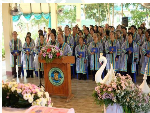
ภาพที่ 5 เทศบาลตำบลป่าไผ่ได้จัดกิจกรรมโครงการศูนย์พัฒนาคุณภาพชีวิต และส่งเสริมอาชีพผู้สูงอายุตำบลป่าไผ่ (โรงเรียนผู้สูงอายุป่าไผ่คุณธรรม)