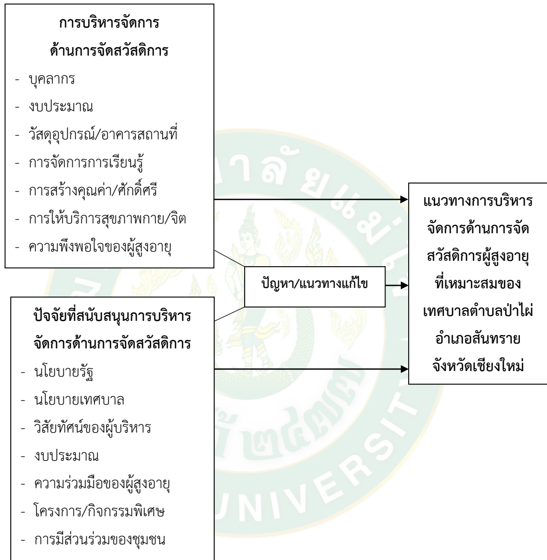
ภาพที่ 1 กรอบแนวคิดการวิจัย