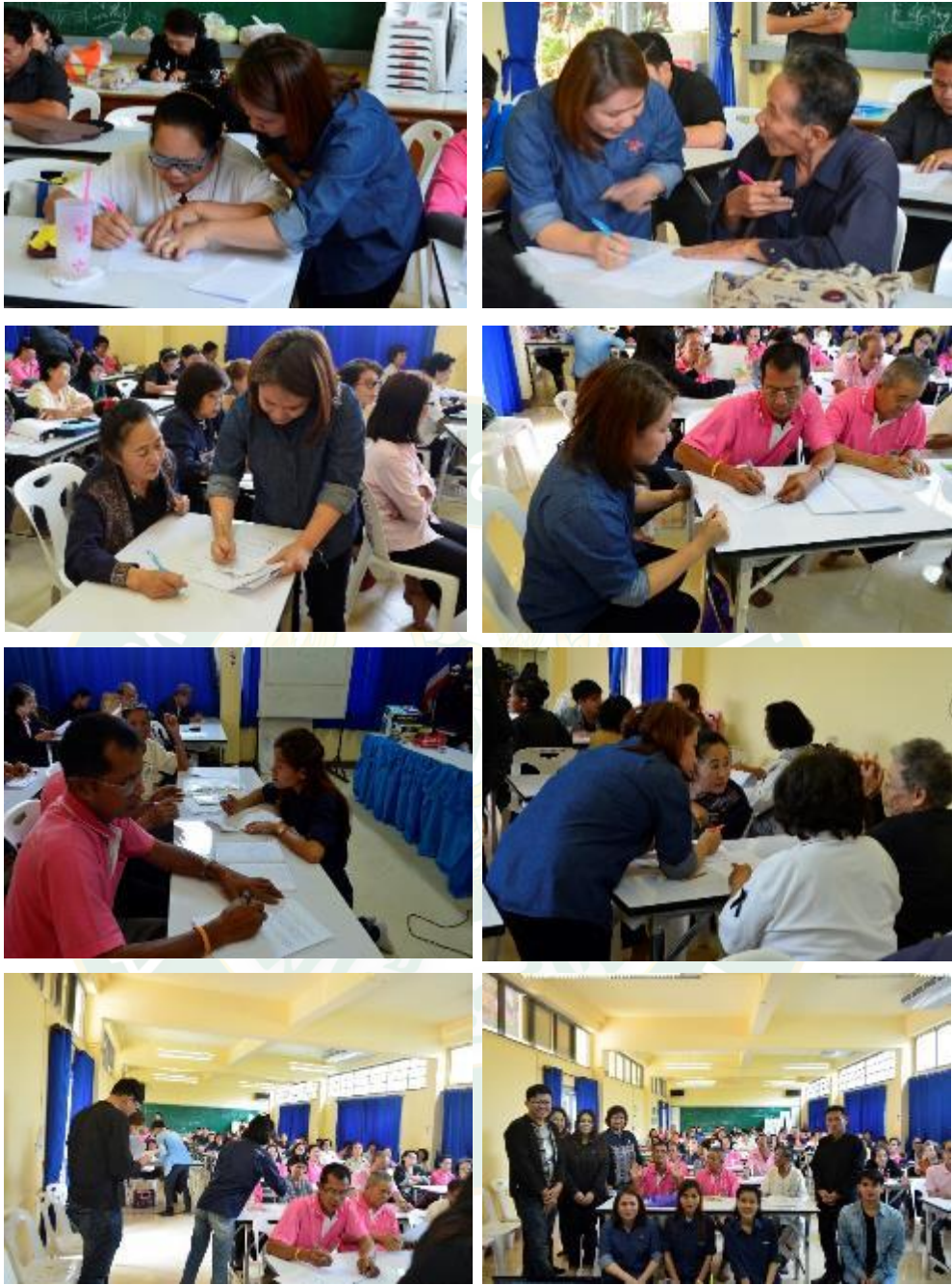
ภาพผนวกที่ 2 การสัมภาษณ์ผู้สูงอายุ