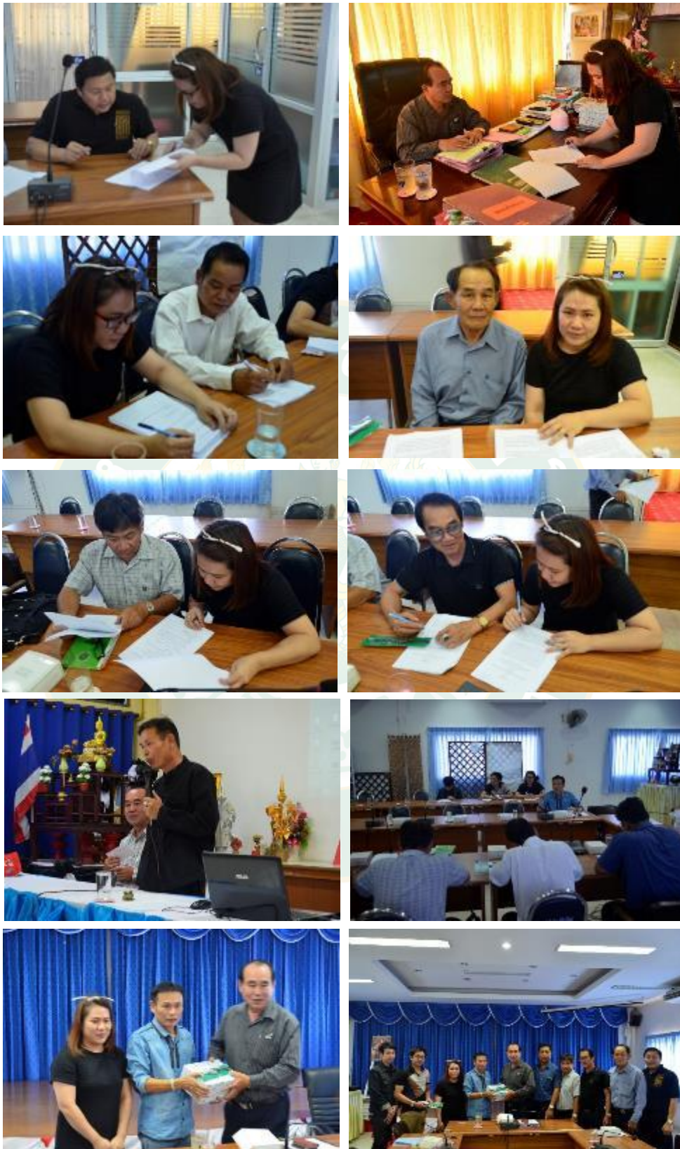
ภาพผนวกที่ 1 การสัมภาษณ์ผู้บริหาร