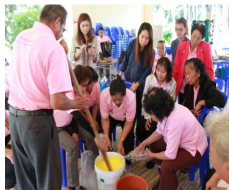
ภาพที่ 2 การดำเนินกิจกรรมโครงการสำหรับผู้สูงอายุของเทศบาลตำบลป่าไผ่ อำเภอสันทราย จังหวัดเชียงใหม่