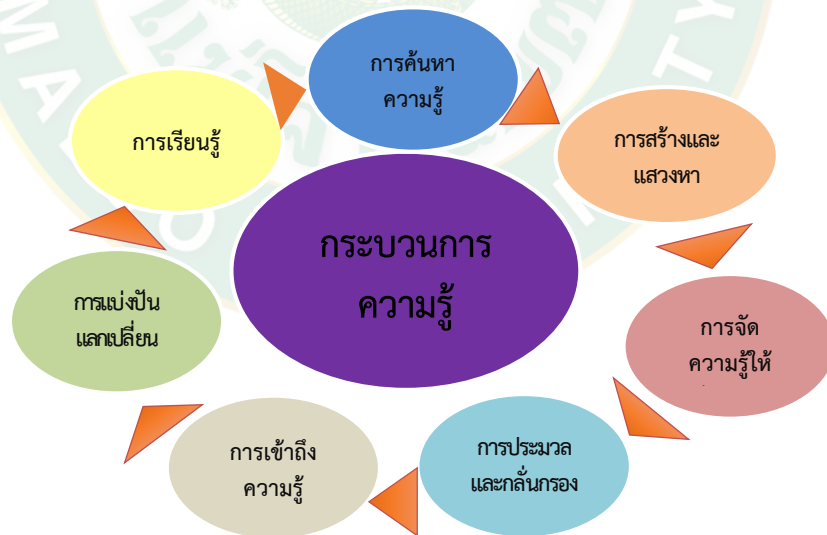
ภาพที่ 3 กระบวนการความรู้

กระบวนการความรู้ถือเป็นกระบวนการหนึ่งที่สำคัญในการช่วยให้องค์กร หรือบุคคลสามารถจัดการกับความรู้ทั้งที่มีอยู่เดิมภายในองค์กร และความรู้ใหม่ ได้อย่างมีประสิทธิภาพ และประสิทธิผล ดังสรุปเป็นแผนภาพ ดังนี้