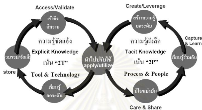
ภาพที่ 1 วงจรการจัดการความรู้ไม่รู้จบ

ตลอดเวลา บางครั้ง ความรู้ที่ฝังลึกก็เปลี่ยนเป็น ความรู้เด่นชัด และบางครั้งความรู้เด่นชัด ก็เปลี่ยนไป เป็นความรู้ที่ฝังลึก เรียกว่า วงจรการจัดการความรู้ไม่รู้จบ