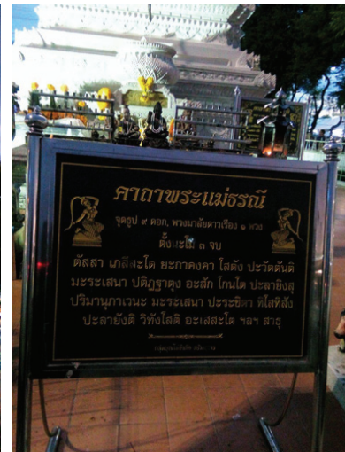
ภาพที่ 1-3 พระแม่ธรณีบิรมวยผม (สนามหลวง)

ธาตุดิน เป็นธาตุที่มีความสำคัญอย่างยิ่ง เพราะทุกสรรพสิ่งบนโลกใบนี้ย่อมต้องอาศัยดินในการเกิด ดำเนินชีวิต ตลอดจนวาระสุดท้ายทุกสิ่งก็จะกลับคืนสู่ดิน พระแม่ธรณี เป็นเทพที่สอดคล้องกับธาตุดิน เรามักพบเห็นประติมากรรมพระแม่ธรณีบิรมวยผมอยู่ตามสถานที่ต่าง ๆ เนื่องจากคนไทยได้นำไปเชื่อมโยงกับเรื่องพระแม่ธรณีในพระพุทธศาสนา การปรากฏของพระแม่ธรณีในศาสนาพุทธคือ ตอนที่พญามารมาขัดขวางการปฏิบัติของพระโพธิสัตว์ เมื่อพญามารวิสวดี ทราบว่า พระโพธิสัตว์