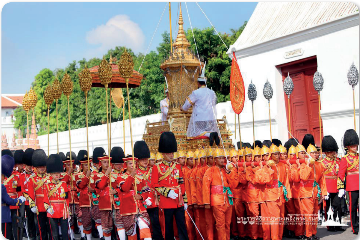
ภาพที่ 3 เครื่องสูงในริ้วขบวนที่ 1