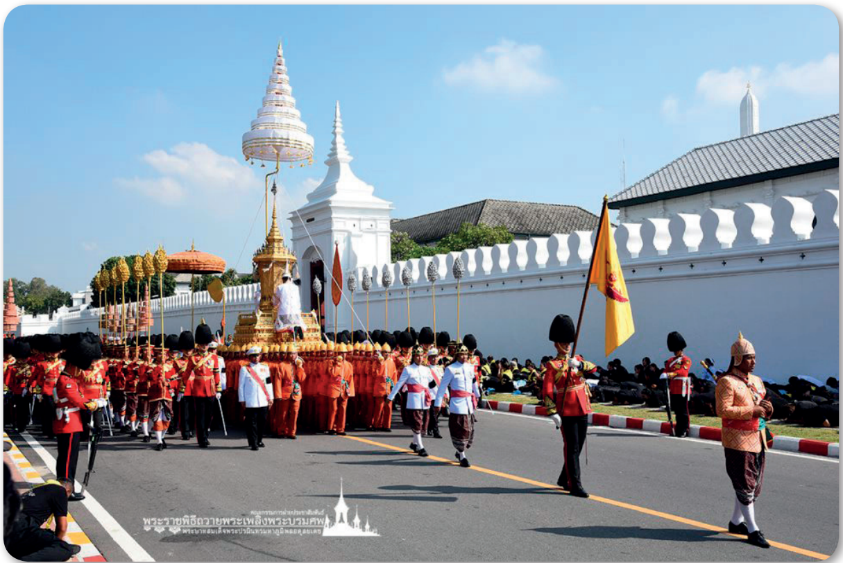
ภาพที่ 5 พระมหาเศวตฉัตรบนพระยานมาศสามลำคาน ในการเชิญพระบรมศพโดยขบวนพระบรมราชอิสริยยศ

เมื่อเสด็จสวรรคต ในการพระราชพิธีพระบรมศพ ได้เชิญพระมหาเศวตฉัตร แขนงเหนือพระโกศพระบรมศพ ณ พระที่นั่งดุสิตมหาปราสาทในพระบรมมหาราชวัง และใช้ปักยอดพระเมรุมาศในมณฑลพระราชพิธีท้องสนามหลวง ใช้ปักบนพระยานมาศสามลำคานในการเชิญพระบรมศพโดยขบวนพระบรมราชอิสริยยศ ใช้ปักเหนือเกรินขณะเชิญพระโกศพระบรมศพขึ้นสู่พระมหาพิชัยราชรถ และเชิญขึ้นประดิษฐานบนพระเมรุมาศ ใช้แขวนเหนือพระจิตกาธานเมื่อสุมพระเพลิงและเก็บพระบรมอัฐิ ทั้งนี้ เพื่อเป็นการแสดงพระเกียรติยศในฐานะที่ทรงเป็นสมมติเทพซึ่งเป็นที่เคารพอย่างสูงสุดในหมู่เทพ