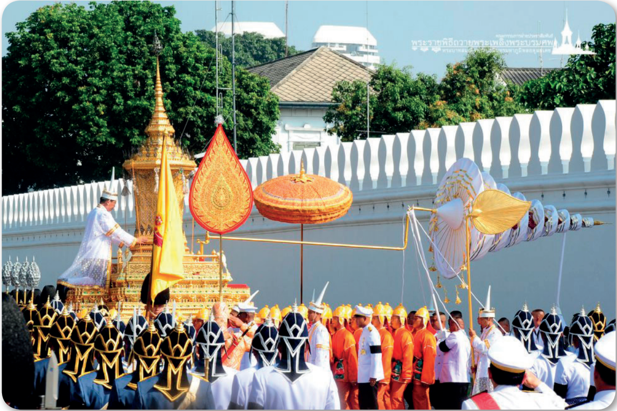
ภาพที่ 2 เครื่องสูงในริ้วขบวนที่ 1