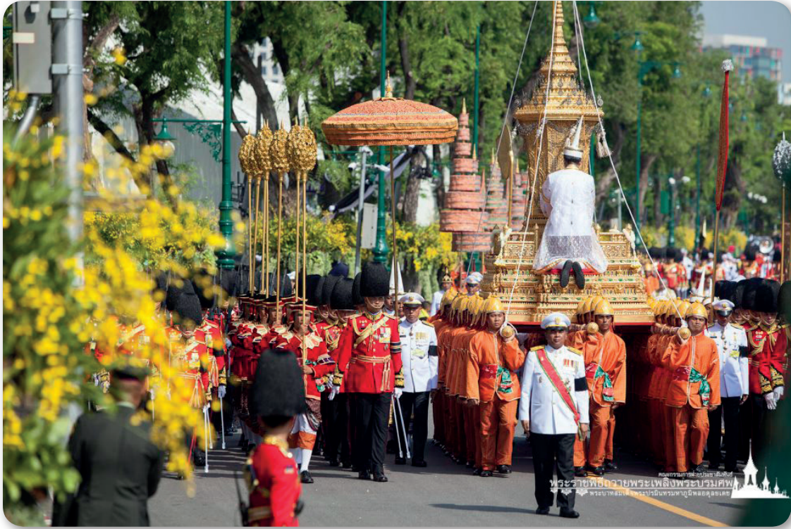
ภาพที่ 7 เครื่องสูงในริ้วขบวนที่ 1

เครื่องสูงทั้งหลายนั้น เป็นสิ่งแสดงวัฒนธรรมและศิลปะอันสูงส่งที่ประดิษฐ์ด้วยฝีมืออันวิจิตรงดงามอย่างที่สุด เนื่องจากเป็นเครื่องราชภัณฑ์ที่แสดงพระราชอิสริยยศของพระมหากษัตริย์ผู้ทรงได้รับการยกย่องเป็นสมมติเทพ ครั้นเมื่อสวรรคตจึงเสมือนเป็นการเสด็จกลับสู่สรวงสวรรค์ ดังนั้น “ริ้วขบวน” อันประกอบด้วย ราชรถ ราชยาน เครื่องประโคม และเครื่องประกอบพระบรมราชอิสริยยศทั้งหลาย จึงถือเป็นการถวายพระเกียรติยศสูงสุดตามโบราณราชประเพณี