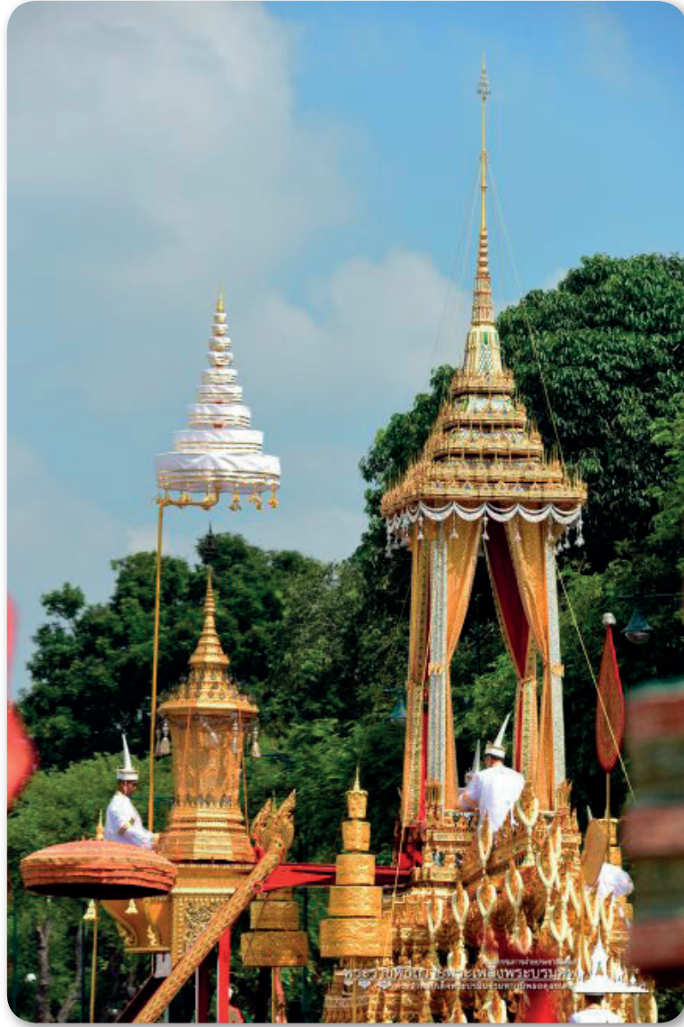
ภาพที่ 6 พระมหาเศวตฉัตรใช้ปักเหนือเกริน ขณะเชิญพระโกศพระบรมศพขึ้นสู่พระมหาพิชัยราชรถ

จากหนังสือเครื่องประกอบพระอิสริยยศ ที่นำเสนอผ่านเว็บไซต์กลุ่มเผยแพร่และประชาสัมพันธ์ กรมศิลปากรนั้น อธิบายเพิ่มเติมว่า นอกจากพระเศวตฉัตร หรือฉัตรผ้าขาวแล้ว โบราณราชประเพณี ยังมีฉัตรที่ใช้สำหรับพระบรมศพ คือฉัตรปักประดับยอดพระโกศพระบรมอัฐิ (ทั้งนี้เนื่องจากยอดพระโกศปกติเป็นยอดพุ่มข้าวบิณฑ์ เมื่อเชิญออกจากที่ประดิษฐานจึงถอดพุ่มข้าวบิณฑ์ออก ถวายฉัตรแทน) กับฉัตรสำหรับปักพระเบญจา ที่ประดิษฐานพระบรมศพด้วย ซึ่งฉัตรปักประดับยอดพระโกศพระบรมอัฐิเป็นฉัตรทองคำจำลองรูปทรงจากฉัตรที่ใช้ปักหรือแขวนแสดงพระอิสริยยศ โดยลักษณะของฉัตรปักประดับยอดพระโกศ สำหรับพระบรมอัฐิพระมหากษัตริย์ ลักษณะเป็นฉัตรทองคำลงยา 9 ชั้น องค์ฉัตรเป็นลายสลักโปร่ง ภายในบุผ้าขาว และพระเบญจา เป็นพระแท่นสำหรับตั้งเครื่องประกอบพระราชอิสริยยศพระโกศพระบรมอัฐิ ซึ่งที่มุมพระเบญจาจัดตั้งฉัตรทองทรงกระบอกลายสลักโปร่ง 5 ชั้น เรียกว่า ฉัตรปักพระเบญจา หนึ่งสำหรับ มี 8 องค์ ตั้งแต่งมุมพระเบญจา ทั้ง 4 มุม