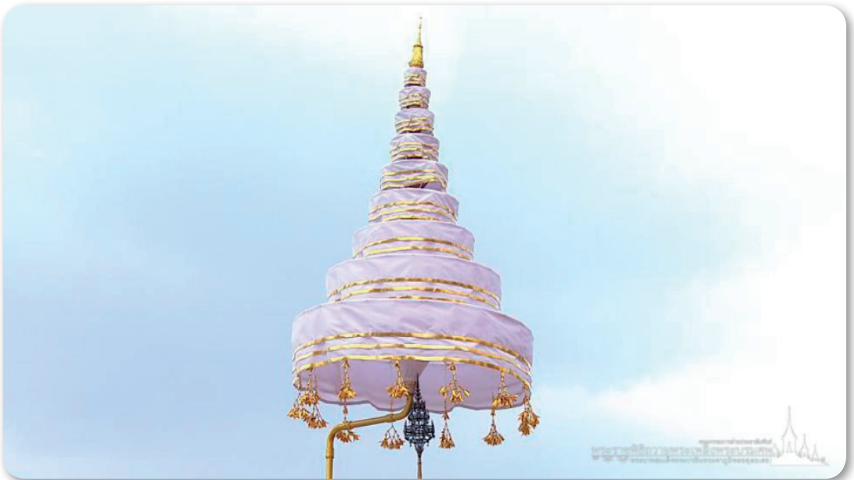
ภาพที่ 4 พระนพปฎลมหาเศวตฉัตร

ในการอันเชิญพระบรมโกศ พระบรมศพพระบาทสมเด็จพระปรมินทรมหาภูมิพลอดุลยเดช บรมนาถบพิตร นอกจากปรากฏเครื่องสูงต่างๆ อันเป็นเครื่องประกอบพระบรมราชอิสริยยศภายในรั้วขบวน ตามที่หม่อมราชวงศ์เทวธิดาธิราช ป. มาลากุล กล่าวถึงแล้ว ยังปรากฏพระนพปฎลมหาเศวตฉัตร หรือ ฉัตรขาว 9 ชั้น อันเป็นเครื่องสูงสำคัญแสดงพระเกียรติยศของพระมหากษัตริย์