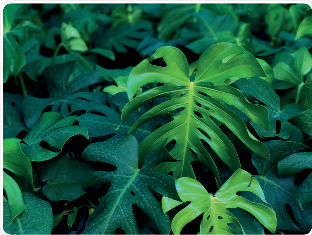
ต้นมอนสเตอร์

นักวิชาการโสตทัศนศึกษา คณะศิลปศาสตร์ มหาวิทยาลัยแม่โจ้