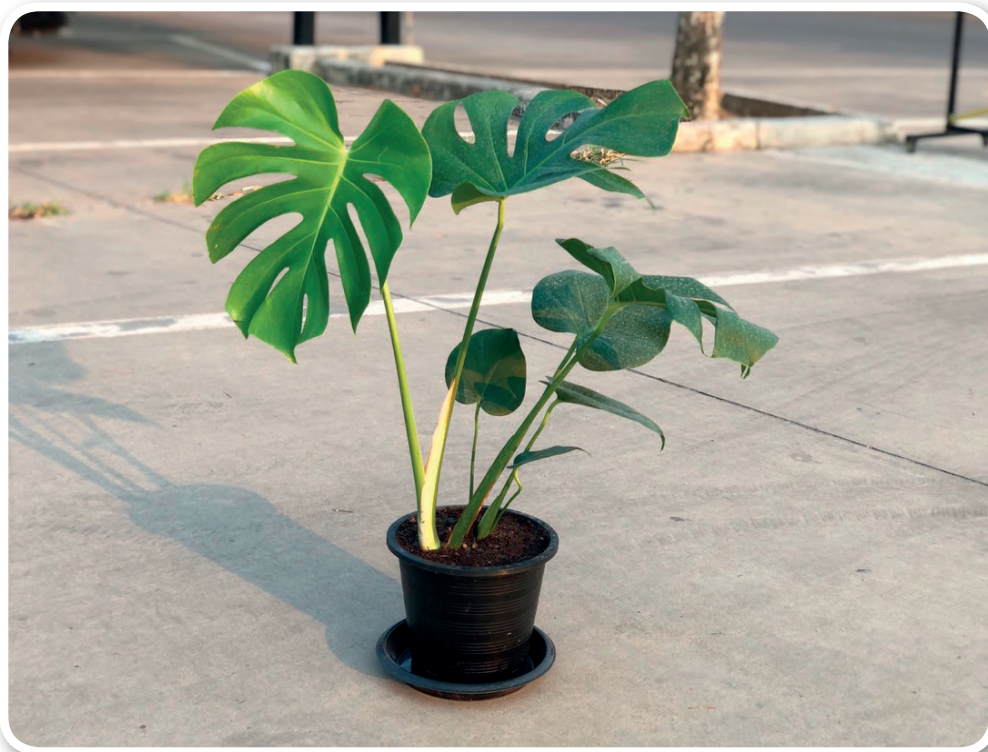
ภาพที่ 1 การนำต้นมอนสเตอร์มารับแสงรำไรยามเช้า

ต้นมอนสเตอร์ (Monstera) มีชื่อวิทยาศาสตร์: Monstera deliciosa Liebm. จัดอยู่ในวงศ์: Araceae เป็นไม้ประเภทเลื้อยขนาดกลาง ลักษณะลำต้นมีข้อสั้น เลื้อยได้ไกล 2 - 4 เมตร และลักษณะของใบเป็นใบเดี่ยว ออกสลับระนาบเดียว รูปหัวใจป้อม ขนาด 20 - 40 x 50 - 90 เซนติเมตร ปลายแหลม โคนเว้ารูปหัวใจ แผ่นใบหนาคล้ายแผ่นหนัง เมื่อตอนต้นเล็กใบหยักเว้าเป็นแฉกและไม่มีช่องระหว่างเส้นใบ เมื่อโตเต็มทีใบเปลี่ยนรูปและมีช่องฉลุ เป็นหนึ่งในต้นไม้ฟอกอากาศ เพราะนอกจากจะสร้างความสวยงาม ร่มรื่น สบายตาแล้ว ต้นมอนสเตอร์ยังมีประสิทธิภาพในการฟอกอากาศในห้องได้ด้วย ถือได้ว่าเป็นราชินีแห่งใบไม้ ที่มีรูปทรงของใบสวยงามชื่อ “ราชินีแห่งใบไม้” เป็นพืชที่มีต้นกำเนิดจากเขตร้อนชื้นตามป่าดิบเขาและหมู่เกาะของทวีปอเมริกา โดยชื่อ Monstera มาจากภาษาละติน Monstrous ที่แปลว่า “ผิดแปลก” เนื่องจากลักษณะรูปทรงของใบที่มีขนาดใหญ่และมีรอยฉีกขาดเป็นลายสวยเหมือนกับได้รับการฉลุอย่างประณีต ทำให้ต้นมอนสเตอร์กลายเป็นไม้ประดับที่ได้รับความนิยมมากขึ้นเรื่อย ๆ ในหมู่นักจัดดอกไม้และนักแต่งบ้าน รูปทรงของใบและสีเขียวเข้มที่สวยงาม โดยถูกนำไปทำเป็นต้นไม้ปลอมหรือลวดลายวอลเปเปอร์ผนังบ้าน อีกทั้งยังนิยมตัดก้านใบปักแจกันประดับแทนดอกไม้