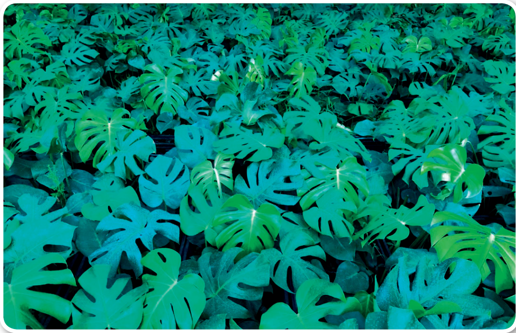
ภาพที่ 4 ใบต้นมอนสเตอร์ที่เขียวสมบูรณ์