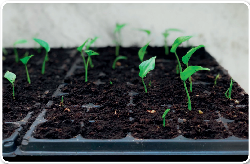
ภาพที่ 6 การขยายพันธุ์เพาะในถาดหลุมด้วยเมล็ด

การปลูกต้นมอนสเตอร์่า ถือได้ว่าต้องใช้ระยะเวลาานพอสมควรในการเพาะปลูกใครที่รักต้นไม้หรือกำลังมองหารายได้เสริม ขอแนะนำสำหรับคนที่มีความรู้และมีเวลาให้กับต้นไม้ เพราะจะต้องใส่ใจดูแลทุกขั้นตอน ตั้งแต่การอนุบาลต้นกล้าจนถึงตอนโต ถือได้ว่าเป็นต้นไม้ที่ต้องใส่ใจทุกรายละเอียด ตั้งแต่การเลือกต้นพันธุ์หรือเมล็ดที่มีคุณภาพ การใส่ปุ๋ยเพิ่มแร่ธาตุ และการควบคุมแสงให้เหมาะสม จึงจะได้ต้นมอนสเตอร์่าที่แข็งแรง ใบฉูด มีแฉก สีเขียวเข้มสวยงาม และถือได้ว่าเป็นต้นไม้ที่สามารถขายได้ทั้งต้นและใบตลอดทั้งปี