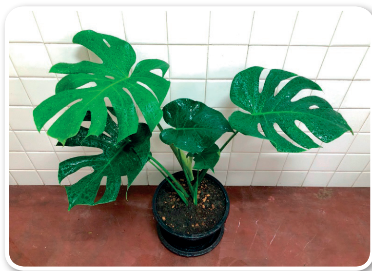
ภาพที่ 3 การตั้งไว้ไม่ให้สัมผัสกับแสงแดดโดยตรง

ใช้กาบมะพร้าวผสมกับดินเพื่อรักษาและดูดซับความชื้น หากกระถางไม่มีรูระบายน้ำไม่ควรรดน้ำมากเกินไป วิธีสังเกต คือ ให้ใช้มือสัมผัสหน้าดินว่ายังมีความชื้นอยู่หรือเปล่า ถ้าดินแห้งเมื่อใดค่อยรดน้ำ ที่สำคัญอย่านำต้นมอนสเตอร่าไปตั้งไว้ให้สัมผัสกับแดดโดยตรงเด็ดขาด แค่เพียงวันเดียวใบเขียวขจีอันสวยงามของมันก็อาจไหม้กลายเป็นสีน้ำตาลได้ ต้นมอนสเตอร่าจะเติบโตด้วยการแตกกิ่งใหม่ออกมาและขยายออกมาเป็นก้านใบใหญ่โตไปเรื่อย ๆ แต่ลำต้นจะไม่สูงขึ้นจากเดิมสักเท่าไร และควรหมั่นใช้ผ้าชุบน้ำเช็ดฝุ่นออกจากใบเพื่อความสวยงาม