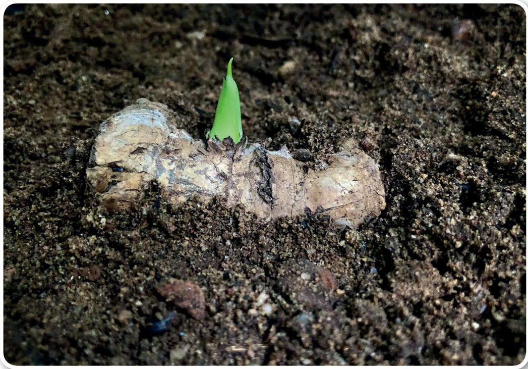
ภาพที่ 5 การขยายพันธุ์ด้วยลำต้น