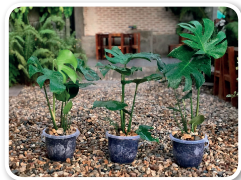
ภาพที่ 2 ใช้ตกแต่งที่โต๊ะทำงาน ในห้องต่าง ๆ หรือ บริเวณรอบบ้าน