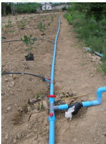
ภาพที่ 10 การรดน้ำโดยการใช้ระบบท่อสายน้ำหยด

2.3 การดูแลมะนาวพันธุ์ตาฮิติ ในช่วงแรกๆต้องรดน้ำสัปดาห์ละ 1 ครั้ง หลังจากนั้นรดน้ำ เดือนละ 2 ครั้ง ใส่ปุ๋ยในช่วงแรกเดือนละ 1 ครั้ง จากนั้น ใส่ปุ๋ย 2 ครั้ง /ปี ถางหญ้า 2 เดือนต่อ 1 ครั้ง คอยตัดแต่งกิ่ง และคอยระวังแมลงรบกวน