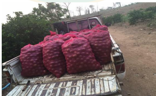
ภาพที่ 14 นำผลมะนาวพันธุ์ตาฮิติส่งไปขายให้พ่อค้าคนกลาง

ในส่วนของต้นกล้ามะนาวพันธุ์ตาฮิติ ถ้าลูกค้าสั่งต้นกล้าเป็นจำนวนมากก็จะขนส่งและจัดส่งให้ลูกค้าฟรี แต่ถ้าสั่งน้อยลูกค้าก็จะมารับต้นกล้าเองที่บ้าน ส่วนผลมะนาวพันธุ์ตาฮิติเกษตรกรบางกลุ่มก็นำไปขายตามจุดที่มีการรับซื้อจากพ่อค้าคนกลาง หรือพ่อค้าคนกลางจะมาซื้อเองที่สวน แต่เกษตรกรจะไม่มีกรรวมกลุ่มในการไปขายให้พ่อค้าคนกลาง จากการวิเคราะห์สิ่งที่พบ พบว่าจุดแข็งของเกษตรกร คือไม่ต้องเดินทางไปส่งไกล ทำให้ไม่เกิดต้นทุนในการขนส่งสินค้า จุดอ่อนคือ เกษตรกรไม่มีการรวมกลุ่ม หรือรวบรวมสินค้าไปขาย ทำให้ไม่มีอำนาจต่อรอง และราคาขายถูก