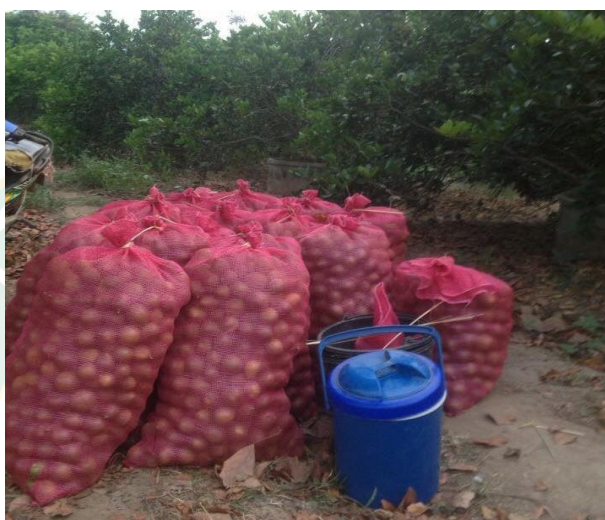
ภาพที่ 15 ผลมะนาวพันธุ์ตาฮิติ พร้อมจำหน่าย

4.1 สินค้า (Product) เกษตรกรจะขายสินค้า 2 อย่าง คือเกษตรกรจะขายต้นกล้ามะนาวพันธุ์ตาฮิติ และขายผลมะนาวพันธุ์ตาฮิติ โดยนำต้นกล้ามะนาวพันธุ์ตาฮิติใส่ในถุงดำเพื่อรอนำขายให้กับผู้ที่สนใจ ส่วนผลมะนาวพันธุ์ตาฮิติเกษตรกรจะนำไปในกระสอบที่มีรูระบายเพื่อไม่ให้มะนาวอับชื้น ซึ่งจะทำให้เกิดการเน่าเสีย แล้วมัดเชือกให้แน่น เพื่อป้องกันมะนาวตกหล่น