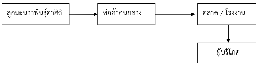
ภาพที่ 16 ช่องทางในการจำหน่ายของผลมะนาวพันธุ์ตาฮิติ