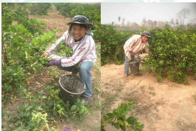
ภาพที่ 12 การเก็บผลมะนาวพันธุ์ตาฮิติ

2.5 วิธีการเก็บเกี่ยวจนถึงแปรรูป เกษตรกรจะเก็บผลผลิตเมื่อมะนาวพันธุ์ตาฮิติมีอายุได้ 1 ปี โดยการเก็บผลมะนาว ฤดูฝนเก็บได้ 400 กิโลกรัมต่อ 1 ไร่ ฤดูแล้งเก็บได้ 200 กิโลกรัม หลังจากนั้นก็สามารถเก็บได้ประมาณเดือนละ 1 ครั้ง