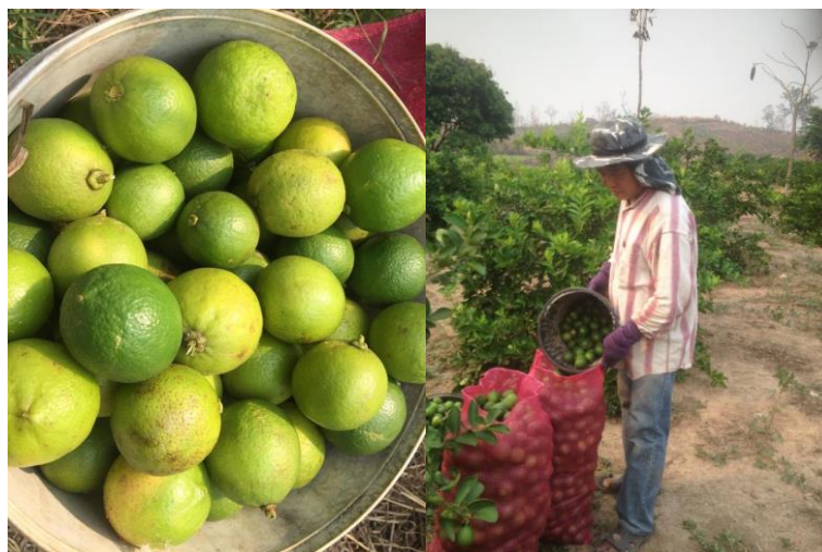
ภาพที่ 13 นำใส่กระสอบ เพื่อทำการจำหน่าย