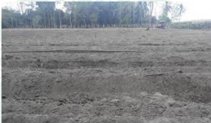
ภาพที่ 8 เตรียมดิน

2.1 การเตรียมดิน เกษตรกรจะมีการขุดหลุมขนาด 50 x 50 เซนติเมตร ลึก 30 เซนติเมตร ระยะห่าง 4 x 4 เมตร และทำการวัดตำแหน่งหลุมปลูก โดยใช้ไม้ไผ่เหลาเป็นแท่งเล็กๆ ปักไว้ตามตำแหน่งที่เราจะทำการขุดหลุม เกษตรกรมีวิธีการเตรียมดินแบ่งออกเป็น 2 วิธี คือ 1) ใช้เครื่องจักร เกษตรกรจะจ้างเกษตรกรที่มีรถไถเตรียมดินทั้งหมด โดยการจ้างเหมาเป็นไร่ ราคาประมาณไร่ละ 700 บาท ใช้เวลาประมาณ 1 วัน 2) ใช้แรงงานคน โดยการที่ไม่ได้จ้างแรงงาน แต่ใช้แรงงานคนในครอบครัว ในการเตรียมดินใช้เวลา 1-2 วัน จากการพิจารณาด้านการเตรียมดินพบว่า จุดแข็ง เกษตรกรส่วนใหญ่ไม่มีการใช้เครื่องจักรในการเตรียมดิน ทำให้เกษตรกรลดต้นทุนในการผลิต