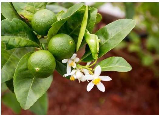
ภาพที่ 2 ดอกมะนาวพันธุ์ตาฮิติ

ดอก ออกเป็นช่อสั้นๆ ตามซอกใบและปลายกิ่ง มีกลีบเลี้ยงเป็นรูปถ้วย ปลายแยกเป็น 5 แฉกกลีบดอก 5 กลีบ ร่วงง่าย สีขาว มีกลิ่นหอม มีเกสรตัวผู้จำนวนมาก