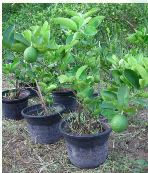
ภาพที่ 6 ต้นกล้ามะนาวพันธุ์ตาฮิติ

ว่าเป็นปุ๋ยที่ช่วยในการเจริญเติบโตของมะนาวพันธุ์ตาฮิติอย่างดี โดยเกษตรกรจะไปซื้อที่ร้านเกษตรใกล้บ้าน โดยการซื้อปุ๋ยพาริช 19-9-9 ราคาประมาณ 830 บาท (กระสอบละ 50 กิโลกรัม) จะใส่ปุ๋ยพาริช เดือนละครั้ง ไร่ละ 20 กิโลกรัม (1ปี 4กระสอบ 3,320 บาท) ส่วนขี้วัว กระสอบละ 25 บาท (กระสอบละ 30 กิโลกรัม) ก่อนเตรียมดินจะใส่ขี้วัว 300 กิโลกรัม (1ไร่ 10 กระสอบ 250 บาท) ยาฆ่าแมลง (ลิตรละ 250 บาท ใช้ได้ 2-5 ปี) ยาฆ่าหญ้า (ลิตรละ 400 บาท ใช้ได้ 2-5 ปี) และฮอร์โมนเร่งดอก (ลิตรละ 550 บาท ใช้ได้ 2-5 ปี) เกษตรกรไม่มีการสร้างโรงเรือนในการเก็บวัตถุดิบ แต่เกษตรกรเก็บวัตถุดิบโดยการวางไว้ใต้ถุนบ้าน ไม่มีการคลุมผ้า และจัดไม่เป็นระเบียบ จากข้อมูลดังกล่าวสามารถพิจารณาจุดแข็งของเกษตรกรได้ว่า เกษตรกรมีการต่อยอดกิ่งขยายพันธุ์ต้นกล้ามะนาวพันธุ์ตาฮิติเอง เพื่อลดต้นทุนของต้นกล้ามะนาวพันธุ์ตาฮิติ และสามารถนำต้นกล้ามะนาวพันธุ์ตาฮิตินำมาขายต่อให้กับเกษตรกรที่สนใจปลูก ส่วนจุดอ่อนเกษตรกรไม่มีโรงเรือนในการเก็บวัตถุดิบในการปลูกมะนาวพันธุ์ตาฮิติ ไม่มีการคลุมผ้า และจัดไม่เป็นระเบียบ อาจทำให้เป็นอันตราย ของเสียหาย และสูญหายได้