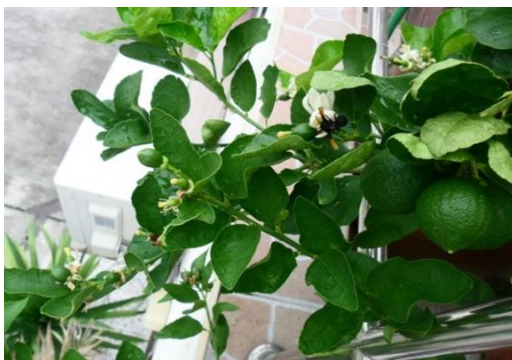
ภาพที่ 1 ใบมะนาวพันธุ์ตาสี

ใบ เป็นใบประกอบ ออกเรียงสลับ มีใบย่อยใบเดียว รูปไข่ หรือรูปรี ยาว กว้าง 3-5 ซม. ยาว 4-8 ซม. ปลายใบแหลม โคนใบมนมีปีกแคบๆ ขอบใบหยัก แผ่นใบใหญ่หนาเข้มมีต่อมน้ำมันกระจายอยู่ตามผิวใบ