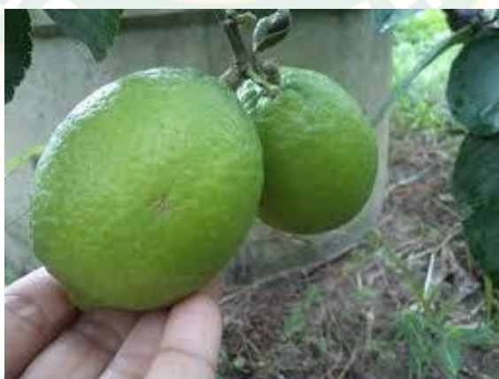
ภาพที่ 3 ผลมะนาวพันธุ์ตาฮิติ

เปลือกผล และผิวผลมีกลิ่นหอมเฉพาะตัวนิยมชุดผิวหรือหั่นเปลือกบางๆ เป็นฝอยๆ โรยหน้าอาหารคาว เช่น ปลา กุ้ง ไก่ และเนื้อ ก่อนนำไปนึ่ง ช่วยดับกลิ่นคาวได้ดีมาก ปัจจุบันในประเทศไทย ร้านอาหารบางแห่งนำเอาผิวผลของ “มะนาวตาฮิติ” มาทำอาหาร