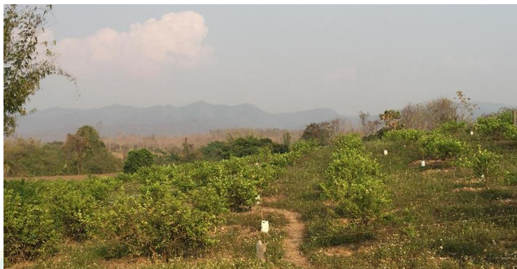
ภาพที่ 11 ต้นมะนาวพันธุ์ตาฮิติที่มีอายุได้ประมาณ 1 ปี

2.4 ระยะเวลาในการปลูกมะนาวพันธุ์ตาฮิติ เมื่อมะนาวพันธุ์ตาฮิติมีอายุประมาณ 1 ปี จะสามารถเก็บผลผลิตมะนาวได้ และหลังจากนั้นก็ยังสามารถเก็บมะนาวได้เดือนละ 1 ครั้ง ซึ่งอายุของมะนาวพันธุ์ตาฮิติอยู่ที่ประมาณ 15-20 ปี ขึ้นอยู่กับสภาพอากาศ และการดูแลรักษา