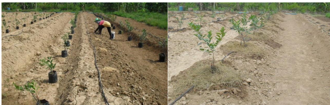
ภาพที่ 9 พื้นที่ในการปลูกมะนาวพันธุ์ตาฮิติ