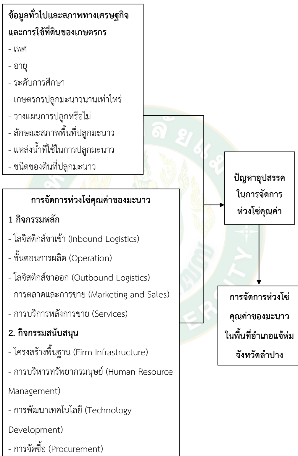
ภาพที่ 5 กรอบแนวคิดการวิจัย