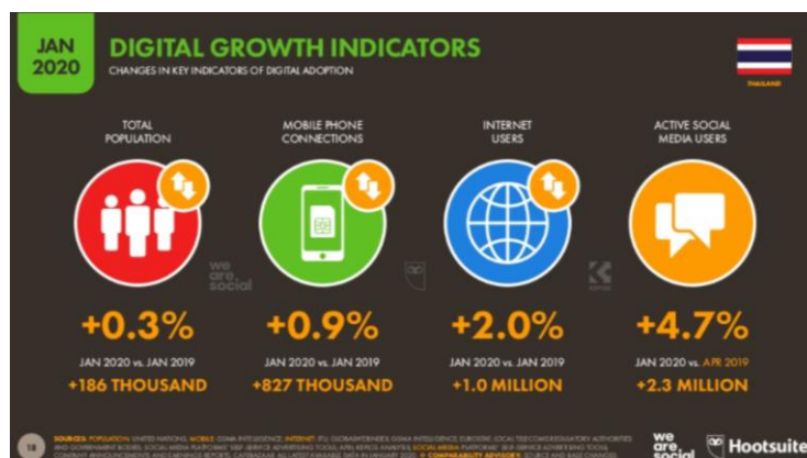
ภาพที่ 1 จำนวนผู้ใช้งานโซเชียลมีเดียในไทยที่เพิ่มสูงขึ้น