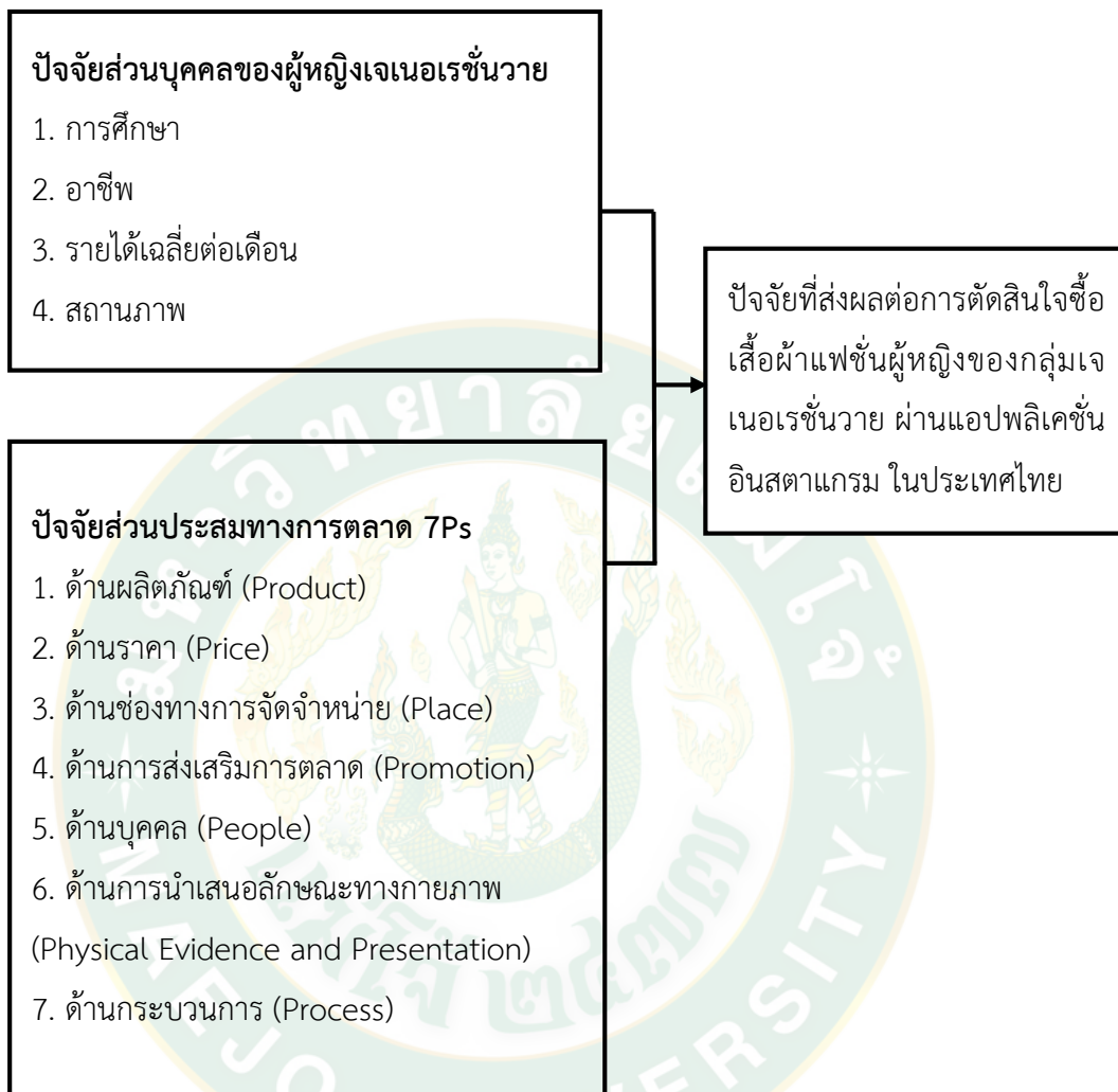
ภาพที่ 4 กรอบแนวความคิดของงานวิจัย