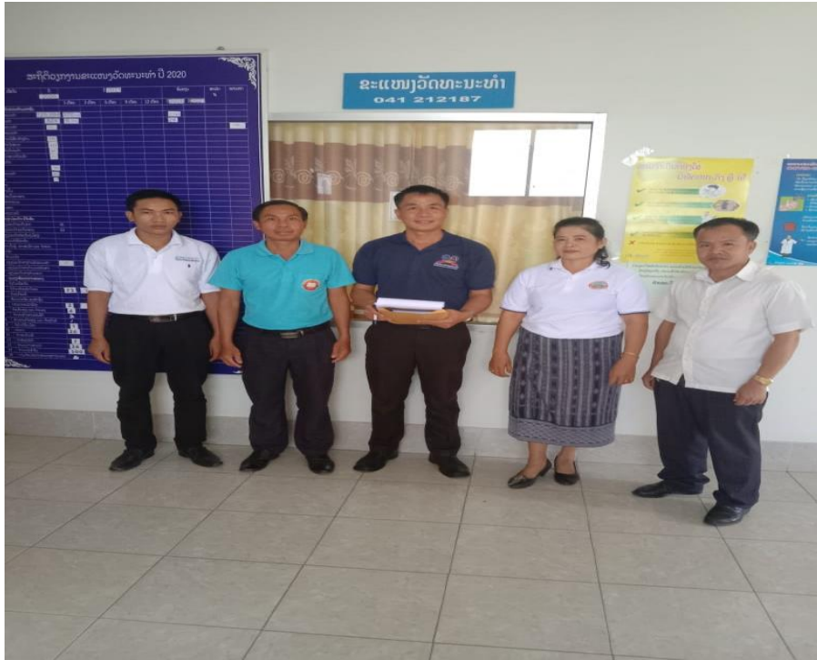
ภาพที่ 7 เจ้าหน้าที่ผู้ให้ข้อมูล และผู้ช่วยเก็บข้อมูลการวิจัย