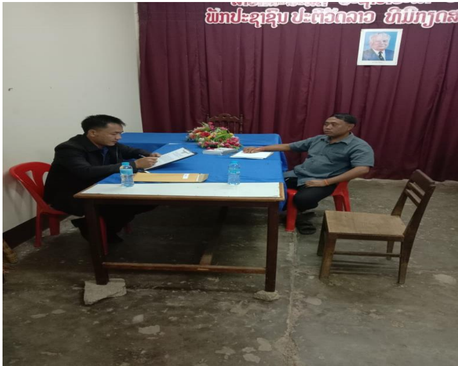
ภาพที่ 9 การสัมภาษณ์เจ้าหน้าที่ห้องการແລງຂ່າວ ວັດນຸຣຣຸມ ແລະ ທ່ອງເທື່ຍວນຊຽໂກສອນພຣມວິຫາຣ ແຂວງສະຫວັນນະເຂດ, ສປປ ລາວ