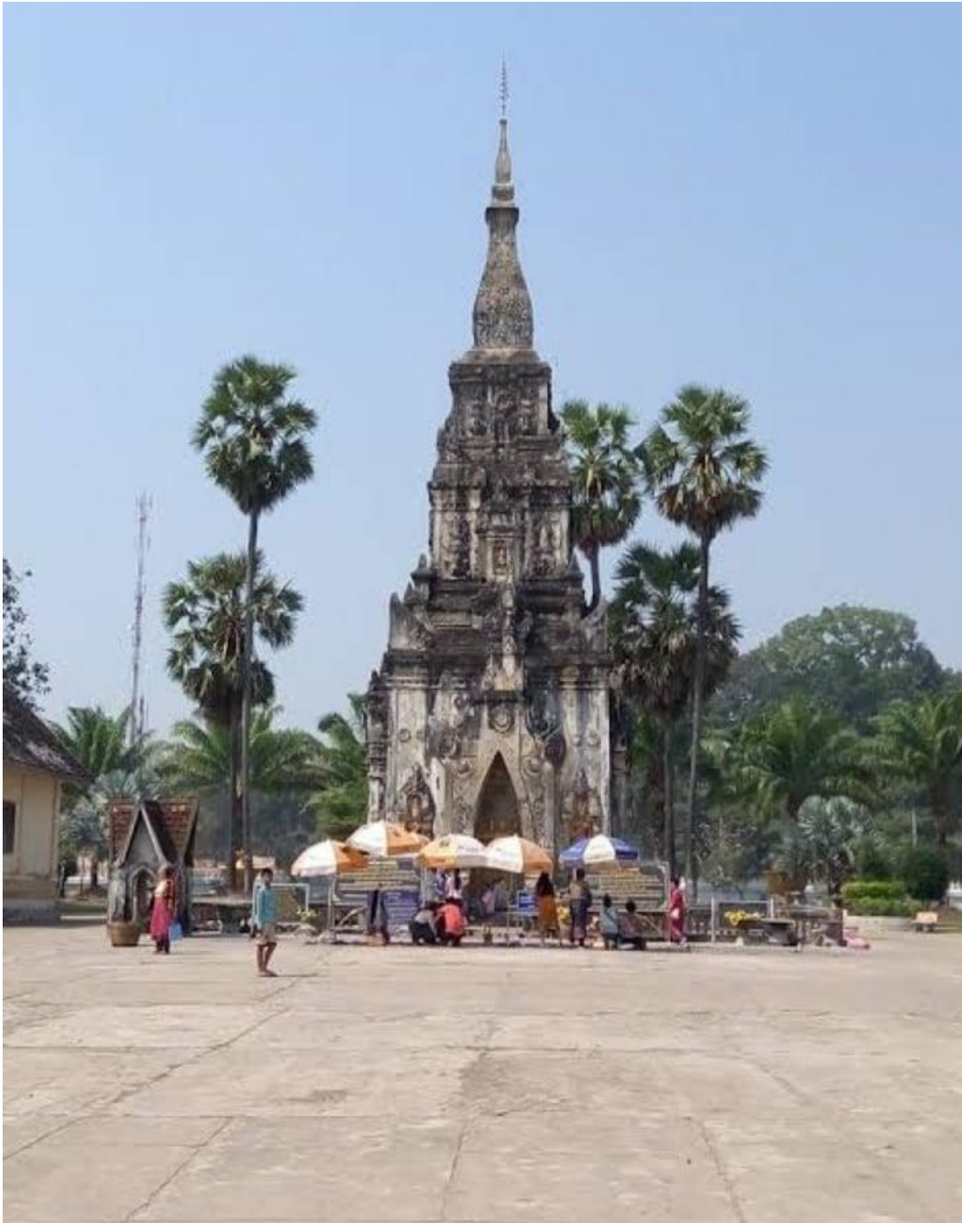
ภาพที่ 6 พระธาตุอิงฮัง