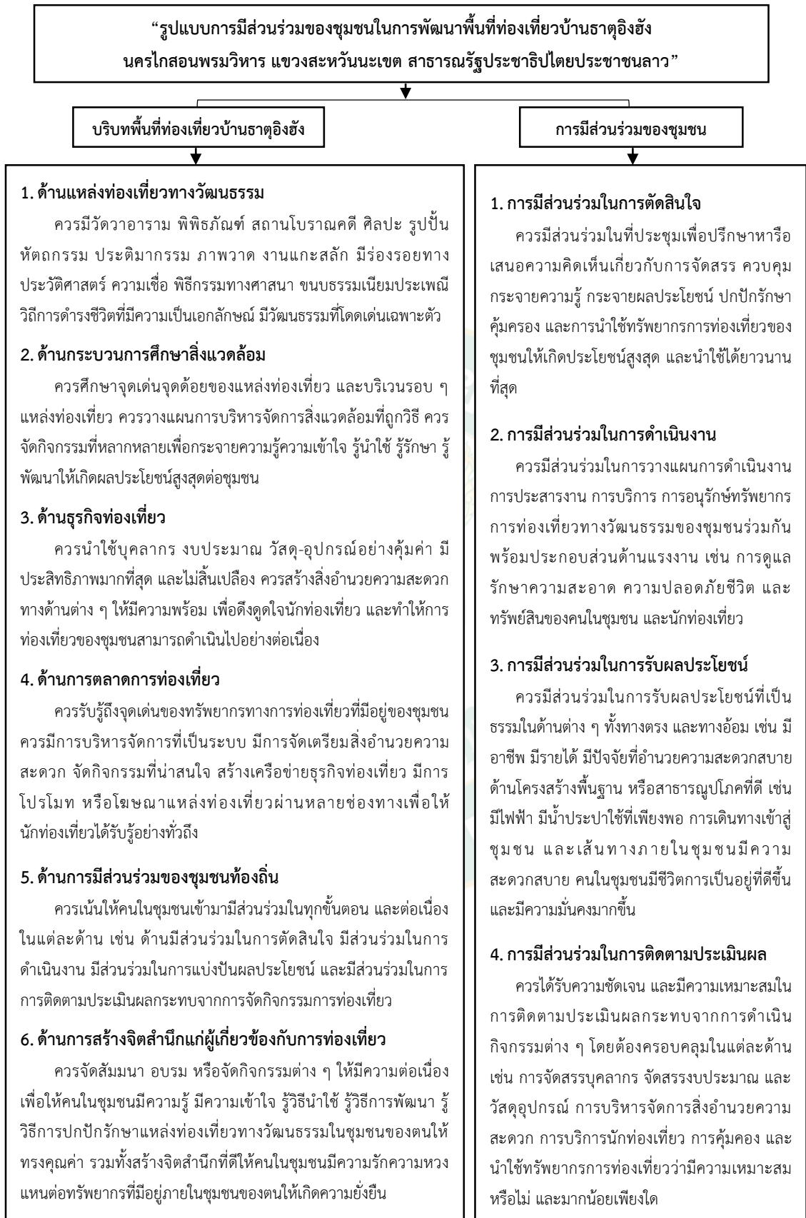
ภาพที่ 5 รูปแบบการมีส่วนร่วมของชุมชนในการพัฒนาพื้นที่ท่องเที่ยวบ้านธาตุอิงฮัง