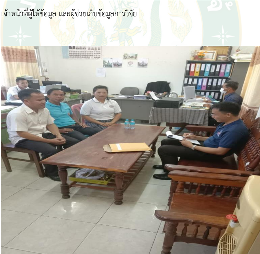
ภาพที่ 8 การสัมภาษณ์เจ้าหน้าที่แผนกแถลงข่าว วัฒนธรรม และท่องเที่ยวแขวงสะหวันนะเขต แขวงสะหวันนะเขต, สปป ลาว