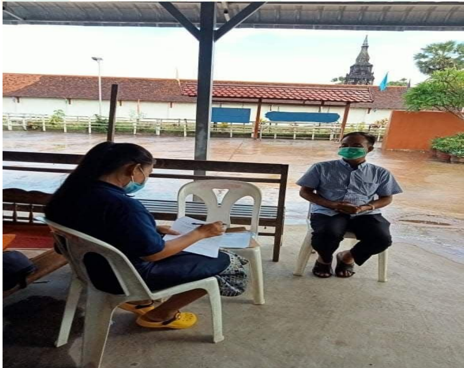
ภาพที่ 10 การสัมภาษณ์เจ้าหน้าที่บ้านธาตุดองฮัง